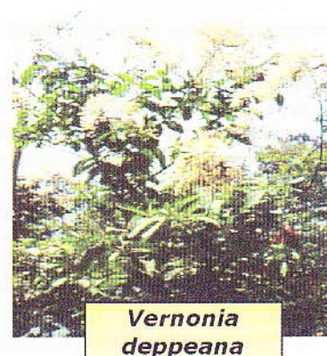
Figura 1: Fotografía de las plantas con bioactividad