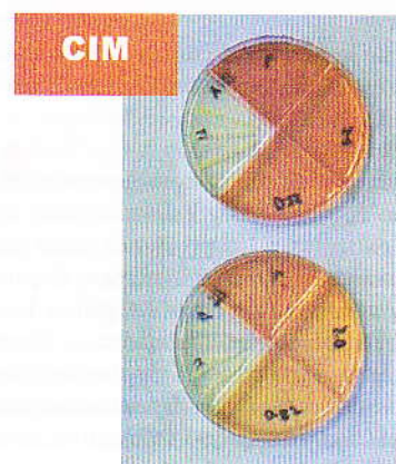
Figura 3. Determinación de la Concentración Inhibitoria Mínima de la actividad antibacteriana de Piper aeruginosibaccum en mg/mL

Esta determinación se realizó únicamente con el extracto de P. aeruginosibaccum , puesto que los otros tres extractos en estudio no presentaron ninguna actividad positiva en la fase de tamizaje. Resultados que se observan en la Tabla 3 y Figura 3.