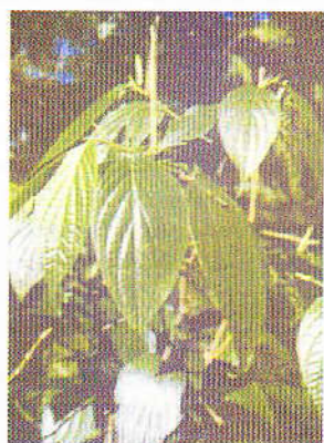
Figura 4. P. aeruginosibaccum

Se observa que el extracto etanólico de P. aeruginosibaccum Figura 4 nuevamente inhibió el crecimiento de los tres microorganismos contra los que ya se había enfrentado en la fase de tamizaje. Coincidentemente a la concentración de 0.5 mg de extracto por mL de agar se inhibió el crecimiento de los tres microorganismos en estudio, por lo que se considera que este valor de concentración corresponde a la CIM in vitro del extracto contra las bacterias Gram positivo: B. subtilis , S. aureus y la micobacteria M. smegmatis . En la concentración de 0.25 mg/mL se observó crecimiento bacteriano por lo que se considera que a esta concentración el extracto ya no tiene actividad.