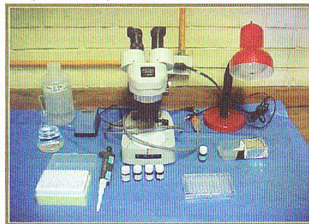
Figura 1. Equipo y materiales necesarios para determinar la citotoxicidad de extractos vegetales contra nauplios de Artemia salina .

tenía actividad positiva si era capaz de matar a más del 50% de los nauplios contra los que se enfrentó. Esto se realizó por triplicado por lo que el valor obtenido es el promedio de los tres pozos de prueba. Para el extracto etanólico que presentó actividad positiva contra los nauplios de A. salina en la fase de tamizaje, se procedió a determinar la dosis a la que el mismo era capaz de matar al 50% de estos crustáceos. Para esto se repitió el procedimiento aplicado en la fase de tamizaje, pero utilizando tres diferentes concentraciones del extracto (1.0, 0.5 y 0.25 mg/mL). El resultado se calculó mediante el programa estadístico Finney's Probit Analysis DOS (18).